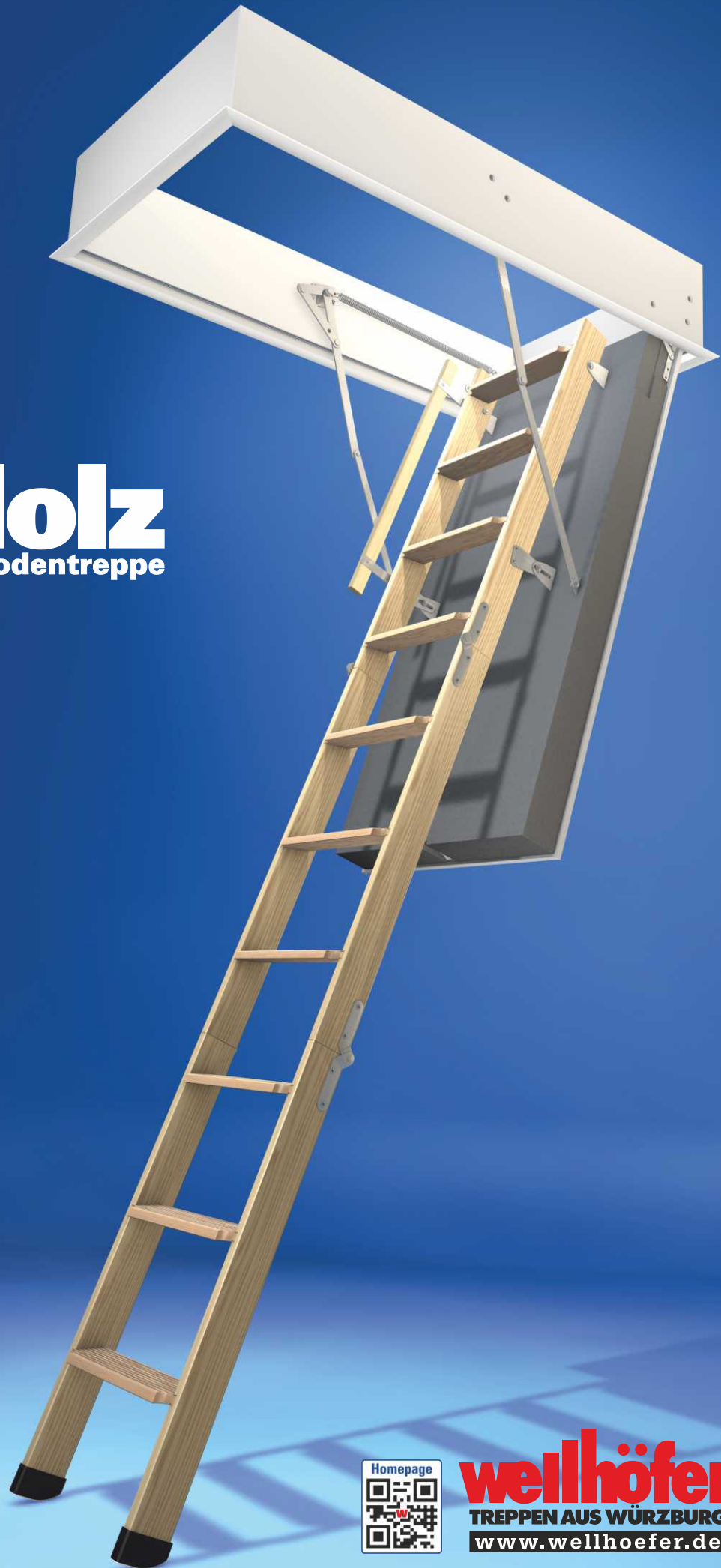
Abbildung zeigt Bodentreppe GutHolz mit Wärmschutz WS4D und Handlauf