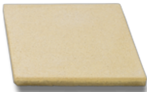
50 x 50