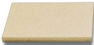
60 x 40

Plattendicke: 4,2 cm, nicht kalibriert \pm 0,3 cm