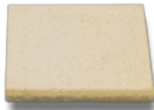
40 x 40